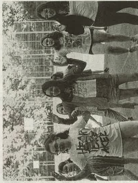
A mozgás volt a közös nyelv a részt vevő gyerekek között